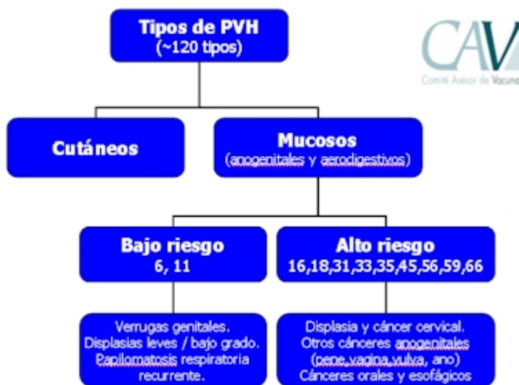
Comité Asesor de Vacunas de la AEP, 2007

Los PVH oncogénicos están también implicados en el desarrollo de otros tipos menos frecuentes de cáncer, como el de canal anal, vulva, pene u orofaringe ( Figura 2 ). 1,3,4,18,19 Por otro lado, la infección con virus considerados de bajo riesgo oncogénico, fundamentalmente los tipos 6 y 11, puede causar verrugas anogenitales (condilomas acuminados) y neoplasias intraepiteliales de bajo grado de vagina, vulva, cérvix, pene y ano. 1,6,7